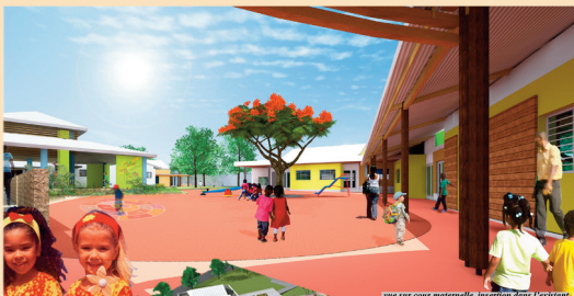
vue sur cour maternelle, insertion dans l'existant

COMMUNE DE L'ANSE-BERTRAND Reconstruction de l'école Maternelle Adela Deschamps, du Réfectoire et réduction de la vulnérabilité sismique de l'école primaire de Macaille