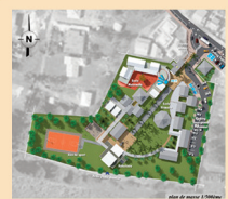
Plan de l'Anse-Bertrand